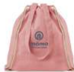
Moira Duo MO9603

Dwukolorowa torba na zakupy z bawełny z recyklingu oraz z poliestru z recyklingu, ze sznurkiem i długimi uchwytnymi. Ok. 140gr / m 2 . Ten produkt może się kurczyć po zadrukowaniu.