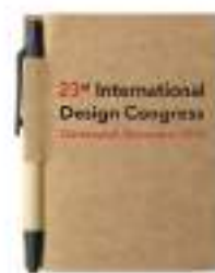
Cartopad MO7626 80-kartkowy notes z długopisem, z papieru z recyklingu. Niebieski wkład.