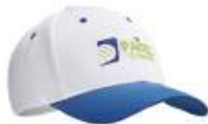
MH2101 MH2101 czapka z daszkiem wykonana z RPET.