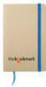
Evernote MO7431 Notes z recyklingu z kolorową wstążką i elastyczną gumką. 96 kartek.