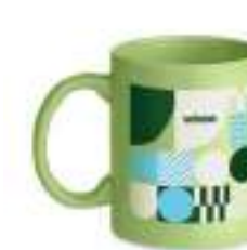
Dublin Tone MO6208

Ceramiczny kubek. Pojemność 300 ml. Pakowany w indywidualne kartonowe pudełko.