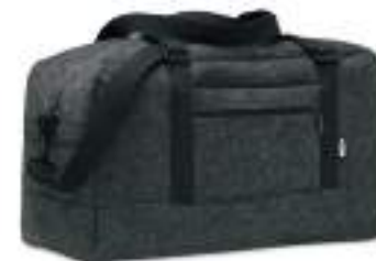
Indico Bag MO6457

Torba z filcu RPET z poliesterowymi sznurkami.