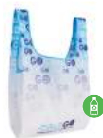
MB1111 Składana torba na zakupy ze 100% RPET