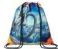
MB3111 Worek ze sznurkiem, 100% RPET.