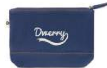
Style Pouch MO6421

Dwukolorowa torba na zakupy z bawełny z recyklingu oraz z poliestru z recyklingu, z długimi uchwytnymi. Ok. 140gr/m 2 . Ten produkt może się kurczyć po zadrukowaniu.