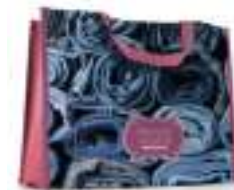
MO4070 Pozioma torba na zakupy z długimi uchwytami z materiału PP. Wymiary torby: 36x32x12cm.