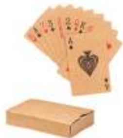
Aruba + MO6201 Klasyczne karty do gry z papieru z recyklingu w papierowym pudełku. 54 karty.