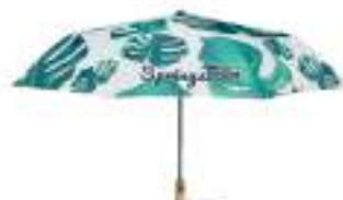
MU2006 MU2006 3-częściowa, 21-calowa (śr. 95 cm) parasolka z drewnianą rączką. Czarny galwanizowany trzon, żebra z włókna szklanego. Automatyczne otwieranie i zamykanie. W komplecie z etui.