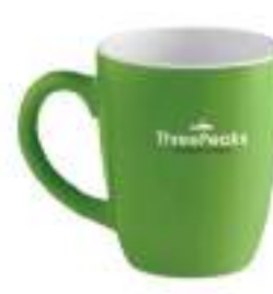
Colour Trent MO9242

Kubek ceramiczny vintage, poj. 240ml. Pakowany w indywidualny biały kartonik. Transfer na ceramice jest odporny na zmywanie w zmywarce.