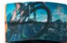
MH3101 MH3101 Kolorowa, uniwersalna opaska na głowę wykonana z elastycznego materiału Recycled-PET. Rozmiarok 25cm x 11cm. Doskonała m. in. do spięcia włosów podczas aktywności fizycznej.