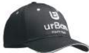
MH2103 MH2103 Wysokiej jakości, 6-panelowa czapka z daszkiem RPET o średniej wysokości. Wstępnie zakrzywiony, trójwarstwowy daszek, warstwa środkowa w innym kolorze, zapięcie RPET narzędzie, daszek przeciwpożnny w 35% z bawełny i w 65% z poliestru. Poliester RPET o delikatnej fakturze, nadający się do wykonania szczegółowego haftu.