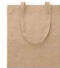
Cottonel Duo MO9424

Torba na zakupy z długimi uchwytnymi z 50% bawełny pochodzącej z recyklingu i 50% bawełny. 250 gr/m 2 .