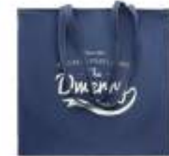
Style Tote MO6420

Bawełniany worek ze sznurkiem do ściągania 50% recyklingowany bawełniany jeans i 50% bawełny. 250 gr/m 2 .