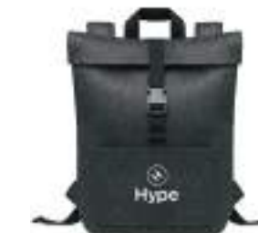
Indico Pack MO6456

Organizer podróżny z filcu RPET z 2 wewnętrznymi i 4 zewnętrznymi przegródkami.