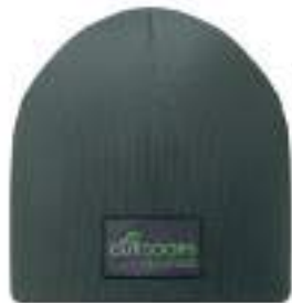
MW1101 MW1101 Dwuwarstwowa czapka typu beanie. 100% RPET.