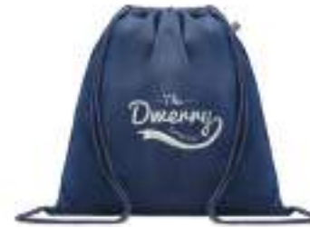
Style Bag MO6422

Dwukolorowa torba na zakupy z bawełny z recyklingu oraz z poliestru z recyklingu, ze sznurkiem i długimi uchwytnymi. Ok. 140gr / m 2 . Ten produkt może się kurczyć po zadrukowaniu.